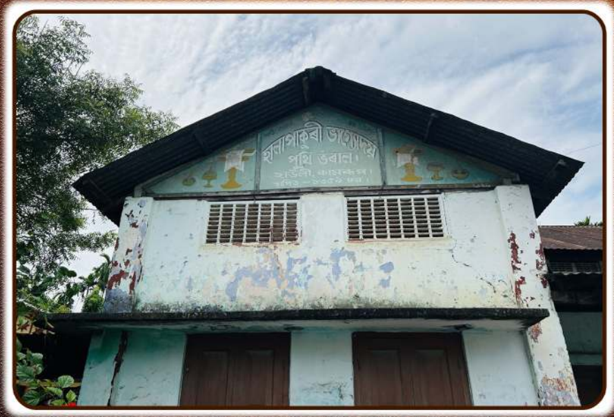
হানাপাকুর্বি ভাণ্ডার পুথিভঁরান