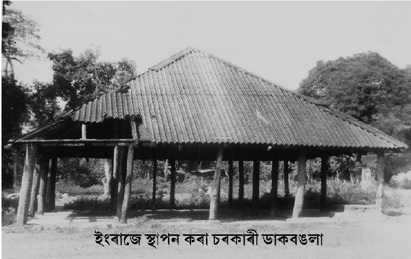
ইংৰাজে স্থাপন কৰা চৰকাৰী ডাকবঙলা