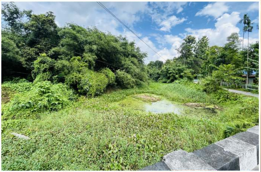
ঐতিহাসিক মৰা মানাহ নদী