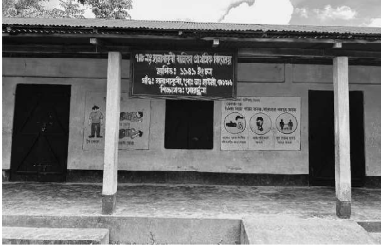
৭০৮ নং হালাপাকুৰী বালিকা প্ৰাথমিক বিদ্যালয়